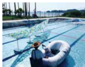
『ぼくたちのうたがきこえますか』 (2022、海のほとり美術館)