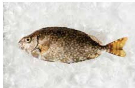
植食魚と呼ばれる「アイゴ」の稚魚。海藻を食べるアイゴは、「磯焼け」の原因の一つとされている