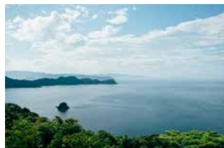
2022年5月末に訪れた大分県津久見市の海

本展では、食べるスープの専門店「Soup Stock Tokyo」と協同で取り組む、アイゴを用いたスープの展開をはじめ、アーティストの作品展示、海をベースに活躍するゲストを迎えたトークイベントやワークショップ、音楽家によるライブを開催。海のレシピプロジェクトが見聞きし、記事にしてきた“海のいま”を伝え、様々な切り口から語り合い、私たちの命の源である“海の森”にアプローチしていきます。ぜひご参加ください！