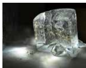
『触れることができる間に』 (2019)