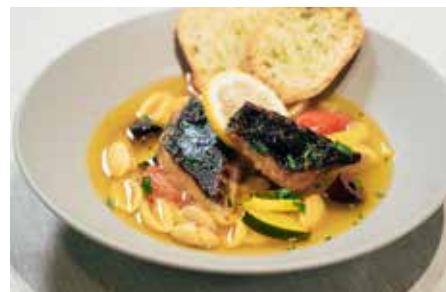
アイゴだしのコクと風味に、夏野菜の旨味と檸檬、サフランを合わせた、爽やかな夏のブイヤベースが完成!

の協業により、無添加で旨味のあるアイゴの干物の製品化を実現。スパイラルガーデンではプロジェクト展示を行い、スパイラルカフェではSoup Stock Tokyo 監修のアイゴだしのスープセットを期間限定でお楽しみいただけます。多くの方とこのおいしさを分かち合いたい！おいしい！から、「海のいま」を感じてください。